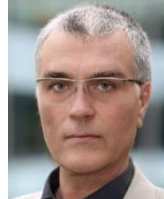
Thomas Metzinger Professor für Philosophie Universität Mainz